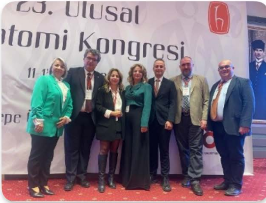
Şekil 7. 23. Ulusal Anatomi Kongresi.