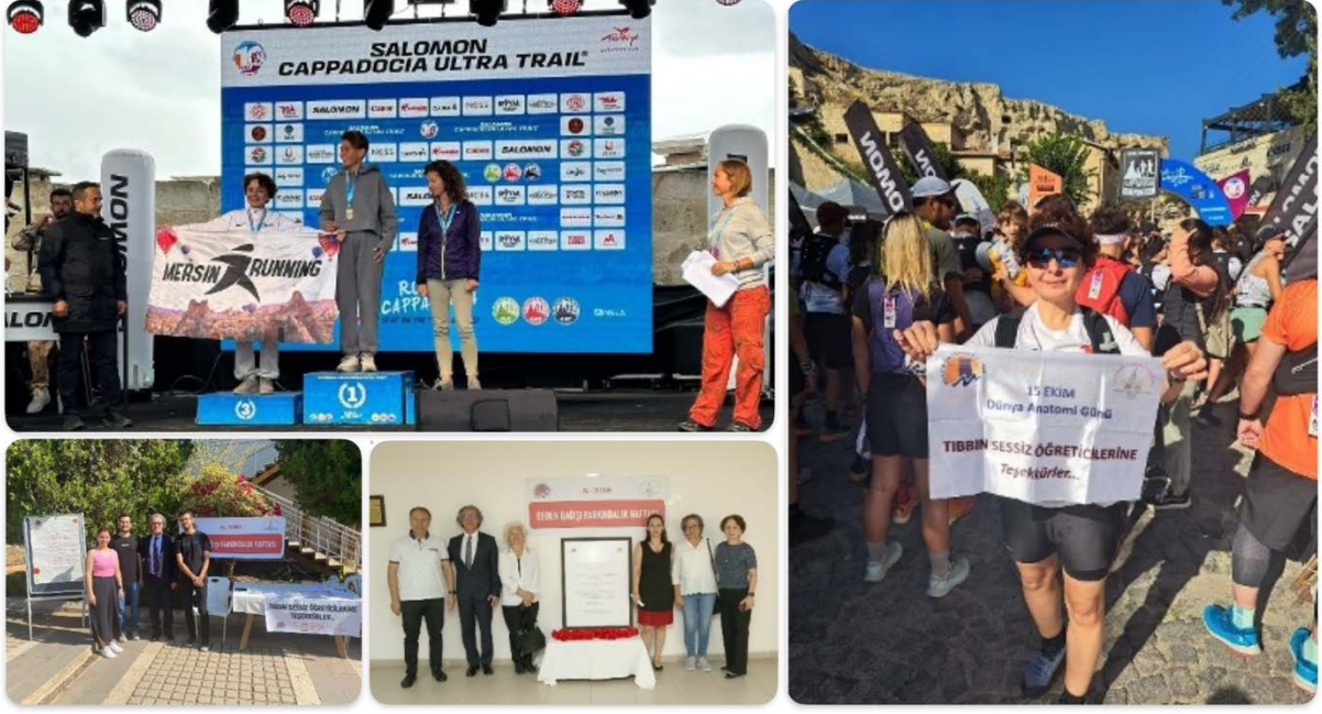
Şekil 12. 10. Uluslararası Cappadocia Ultra Trail maratonu.

Hacettepe Üniversitesi Tıp Fakültesi öğretim elemanları kongre süresince katılımcılar ile 15 Ekim Dünya Anatomi Günü ile ilgili görüş ve temennilerini içeren küçük röportajlar gerçekleştirilerek bir video hazırlandı.