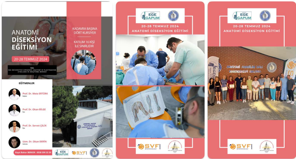
Şekil 5. Anatomi Diseksiyon Eğitimi.

Ege Üniversitesi Tıp Fakültesi Anatomi Anabilim Dalı, Ege Üniversitesi Girişimsel Anatomi ve Plastinasyon Uygulama ve Araştırma Merkezi ve Türk Anatomi ve Klinik Anatomi Derneği (TAKAD) işbirliği ile genç anatomistler için 20-28 Temmuz 2024 tarihleri arasında Anatomi Diseksiyon Eğitimi başlıklı kurs düzenlendi.