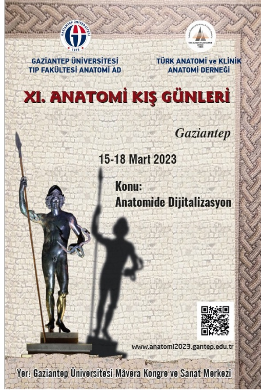
Şekil 6. XI. Anatomi Kış Günleri Posteri.

15-18 Mart 2022 tarihleri arasında Türk Anatomi ve Klinik Anatomi Derneği'nin katkıları ile Gaziantep'te yapılması planlanan XI. Anatomi Kış Günleri toplantısı 11 ili kapsayan Kahramanmaraş merkezli deprem felaketi nedeniyle iptal edilmek zorunda kaldı.