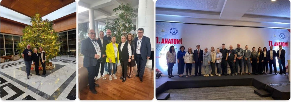
Şekil 8. 11. Anatomi Kış Günleri toplantısı.