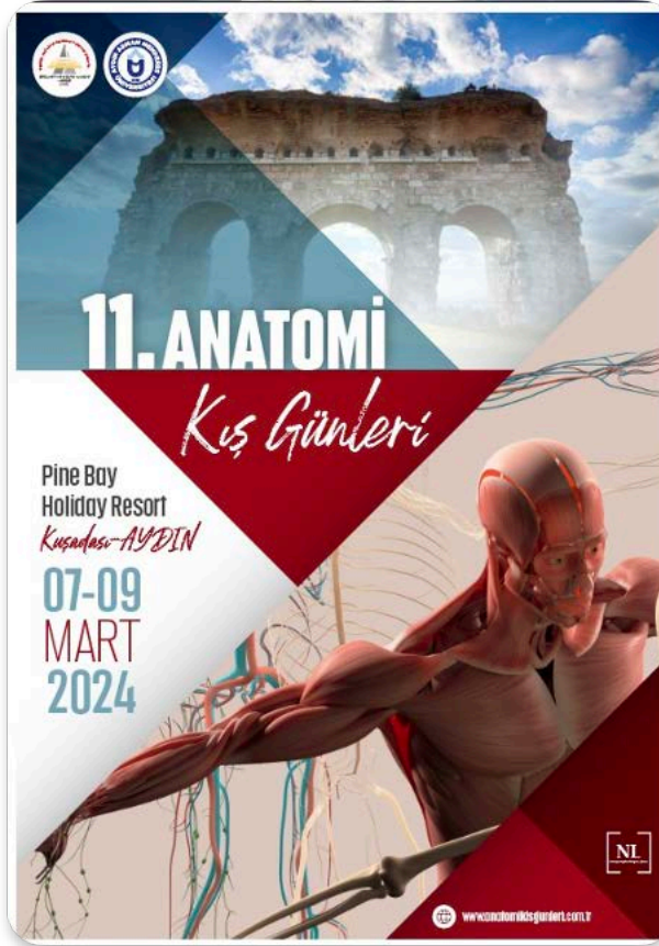
Şekil 9. 11. Anatomi Kış Günleri toplantısı Posteri.