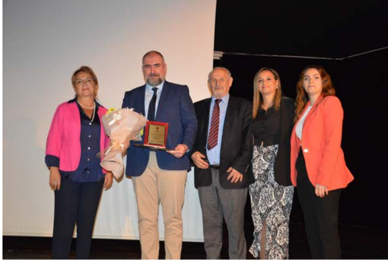
Şekil 11. Dünya Anatomi Günü.

katılımcılara kadavra bağışının insan anatomisi eğitimindeki hayati önemini vurgulayarak, bu konudaki farkındalığı artırmaya yönelik önemli bilgiler sundu.