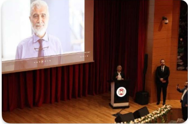
Şekil 3. Prof. Dr. Bayram Ufuk Şakul Klinik Anatomi ve Diseksiyon Laboratuvarı'nın açılış Töreni.