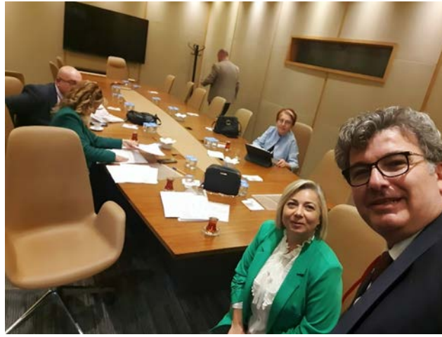
Şekil 10. TAKAD Yönetim Kurulu Toplantılarına ait bir görsel.

TAKAD Yönetim Kurulu olarak, derneğimizin faaliyetlerini etkin bir şekilde sürdürmek ve hızlı kararlar almak amacıyla, düzenli aralıklarla ve ihtiyaç duyulduğunda daha sık olmak üzere mümkünse yüz yüze mümkün değil ise ZOOM uygulaması üzerinden çevrim içi toplantılar düzenlemekteyiz. Bu toplantılar, Yönetim Kurulu üyelerimizin aktif katılımıyla gerçekleştirilmekte ve derneğimizin hedefleri doğrultusunda stratejik planlamaların yapılmasına, güncel konuların değerlendirilmesine ve alınan kararların hızlı bir şekilde uygulanmasına olanak tanımaktadır. Bu sayede, derneğimizin kurumsal yapısını güçlendirmek ve etkinliğini artırmak için çalışmalarımızı kesintisiz olarak sürdürmekteyiz.